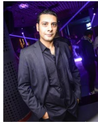
رامي يعيد التراث والفولكلور الموسيقي الافريقي بأمريكا