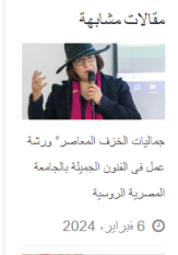
جماليات الحرف المعاصر" ورشة عمل في القرون الجميلة بالجامعة المصرية الروسية 6 فبراير، 2024