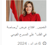
الغفيس. افتتاح عرض "رصاصه في الطب" على المسرح القومي 6 فبراير، 2024