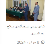
شاعر روسي يترجم إنتمار سلاح عبد المنير 6 فبراير، 2024