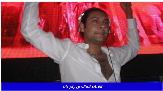
الفنان العالمي رام باند

جماليات الحرف المعاصر" ورشة عمل في الفنون الجميلة بالجامعة المصرية الروسية رئيس جامعة المنوفية بنقذ انتخابات عضوة مجلس صندوق تحسين العاملين بالجامعات الحكومية كرست لتطوير الفعاري : 1.2 مليار جنيه مستهدفات ميمفات مشاريع في 2024 عاجل:القمائل الفلسطينية تقرب من تسليم ردها على اتفاق باريس وزير التعليم العالي يشهد حفل ترشح الطلاب بكلتي الهندسة والحاسبات والمعلومات بجامعة عين شمس